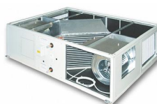
LMF RKE 300–6000 м³/ч