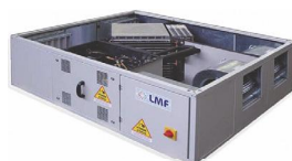
LMF RFM 900–4000 м³/ч