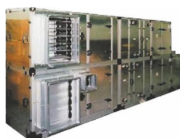
Lufberg LS/LR 2000–100 000 м³/ч