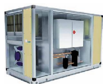
LMF HPS 1200–13 200 м³/ч