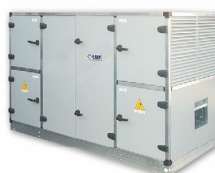
LMF HPX 2400–14 000 м³/ч