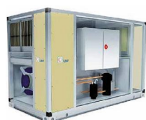
LMF HPH 1200–19 000 м³/ч