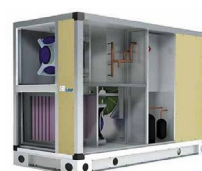
LMF HPR 1200–19 000 м³/ч