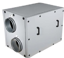
2VV ALFA85 700–7500 м³/ч