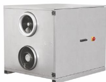
Ruck RLI 1700–11 210 м³/ч